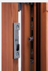
Ferramenta con scontro di chiusura e nottolino di sicurezza