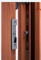
Ferramenta con scontro di chiusura e nottolino di sicurezza